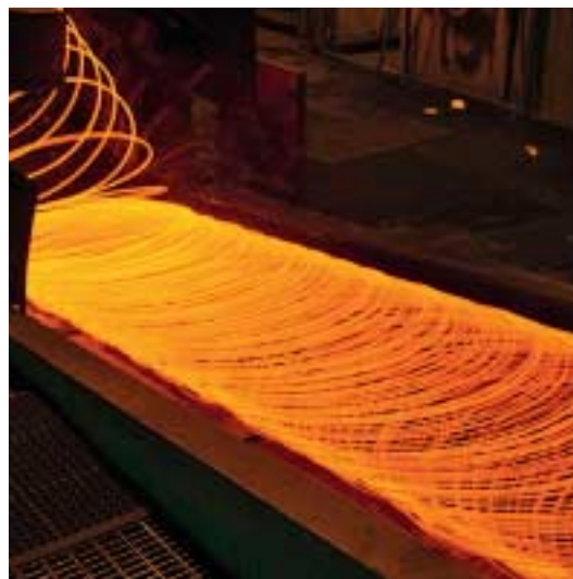
Av företagets totala energiförbrukning består 60 procent av el.